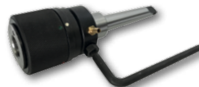
Obj. č. DJXK_50_MT2